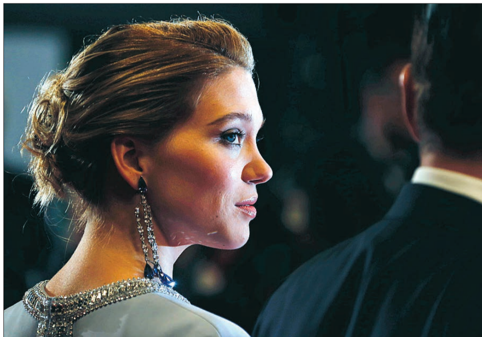
Léa Seydoux, skuespiller, fylder i dag 30 år.

Alligevel er det nok for sin fransktalende rolle i filmen "Adeles liv", at flest danskere husker hende. Helt uhørt valgte juryen ved Cannes Filmfestival i 2013 at tildele