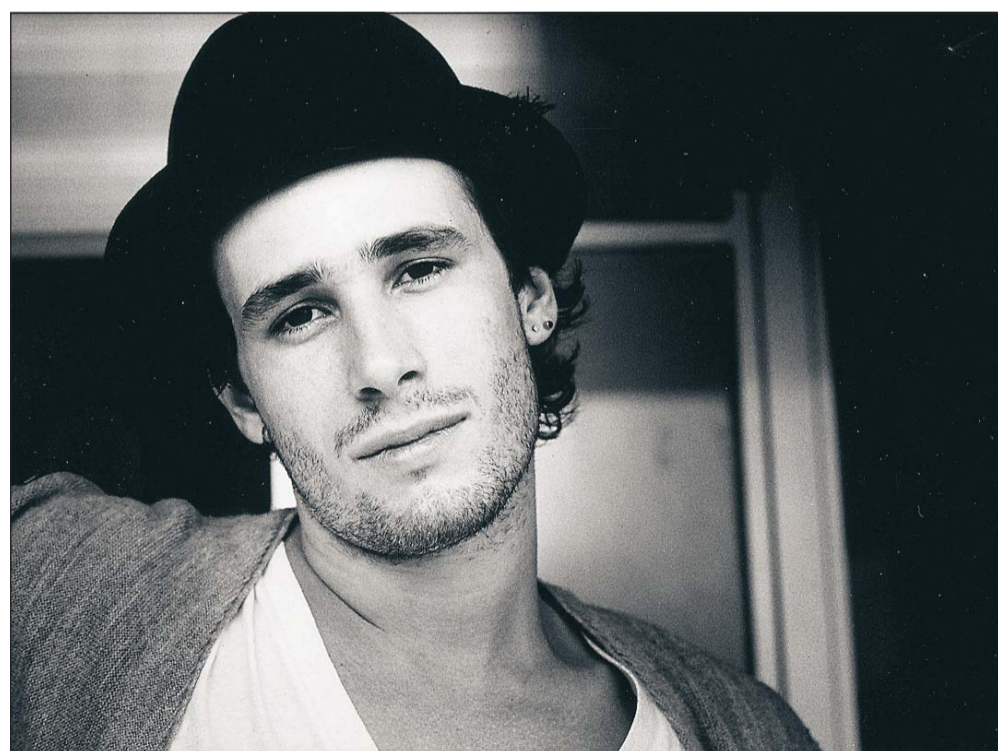
Singer-songwriteren Jeff Buckley - døde 30 år gammel og blev endnu et ikon for rockfans verden over.