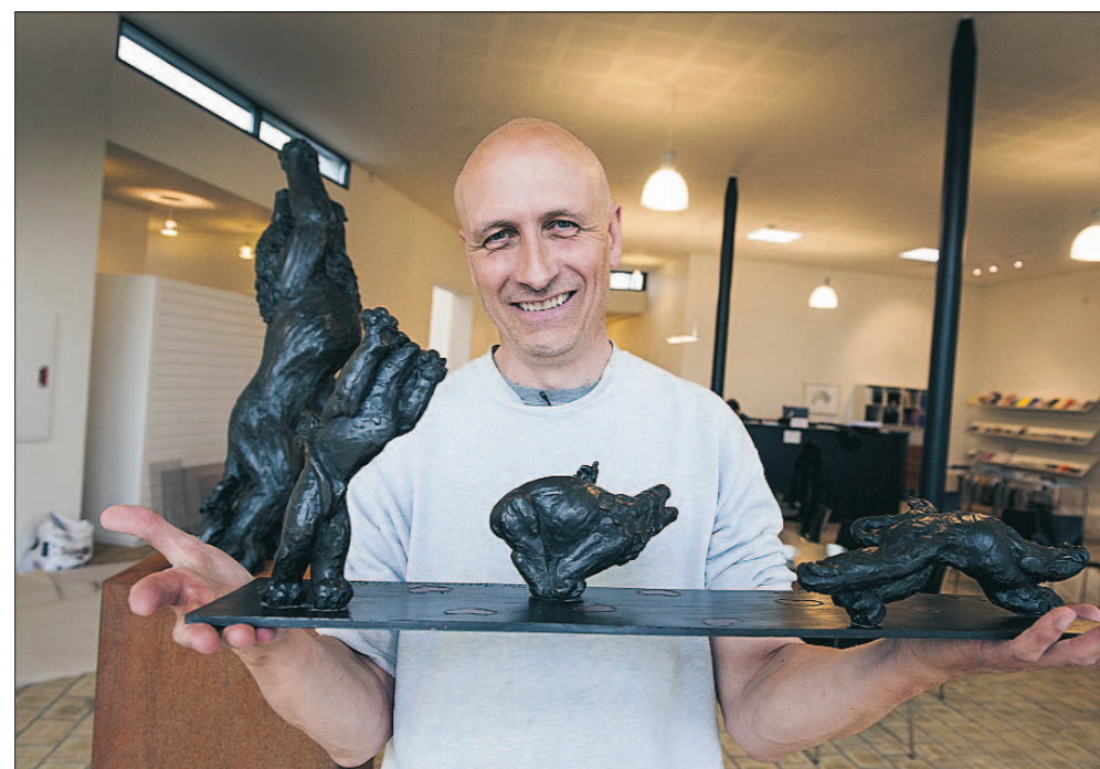
Skulpturinstallationen "Tre løver og ni hjerter" var en gave til Dronning Margrethes 70 års dag. I første omgang fik hun blot den første lille model.

Først tænkte kunstneren, at dronningen skulle have én løve, men det blev - inspireret af det danske rigsvå-