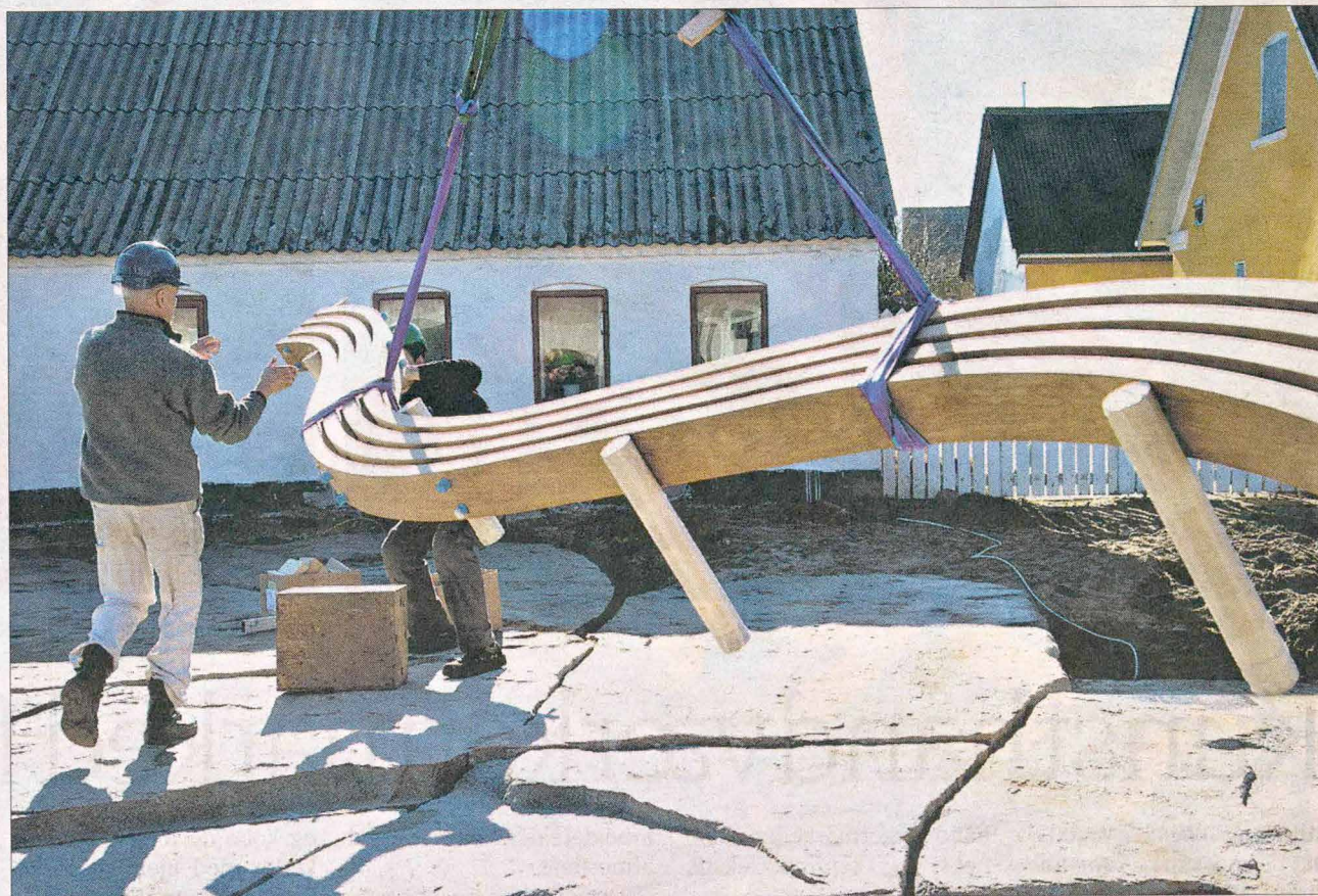
Dele til kunstbænk ved at ankomme til Karens Plads

NØRREGADE 4D · HIRTSHALS · TLF. 9894 2080