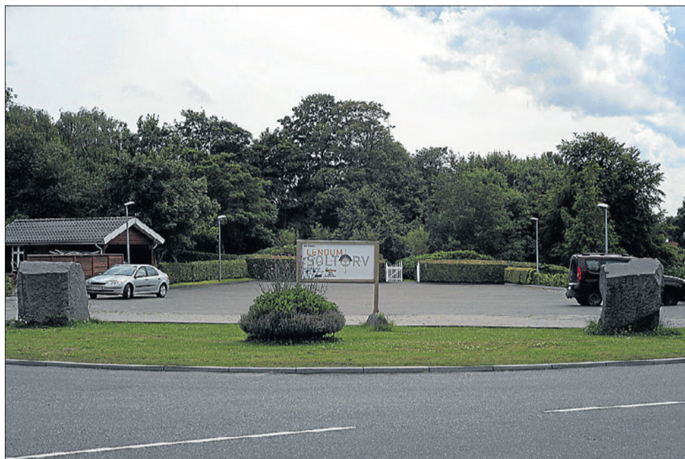
Den nuværende parkeringsplads midt i byen omdannes snart til det nye "Soltorv".