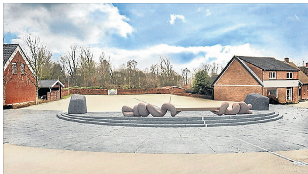
Illustration af det nye "Soltorv" i Lendum.