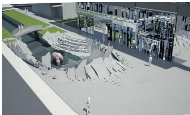
De store skiferplader ligner nærmest en eksplosion, der baner sig vej gennem de ellers ret stramme betonkanter i kanalen. Illustration: Martin Byrialsen/Claus Ørntoft