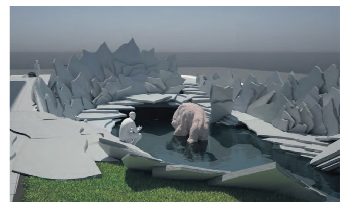
Billedhugger Claus Ørntoft er blandt andet kendt for at lave store dyr i granit, og sådan et forestiller han sig selvfølgelig også, der skal være på Østre Havn. Illustration: Martin Byrialsen/Claus Ørntoft