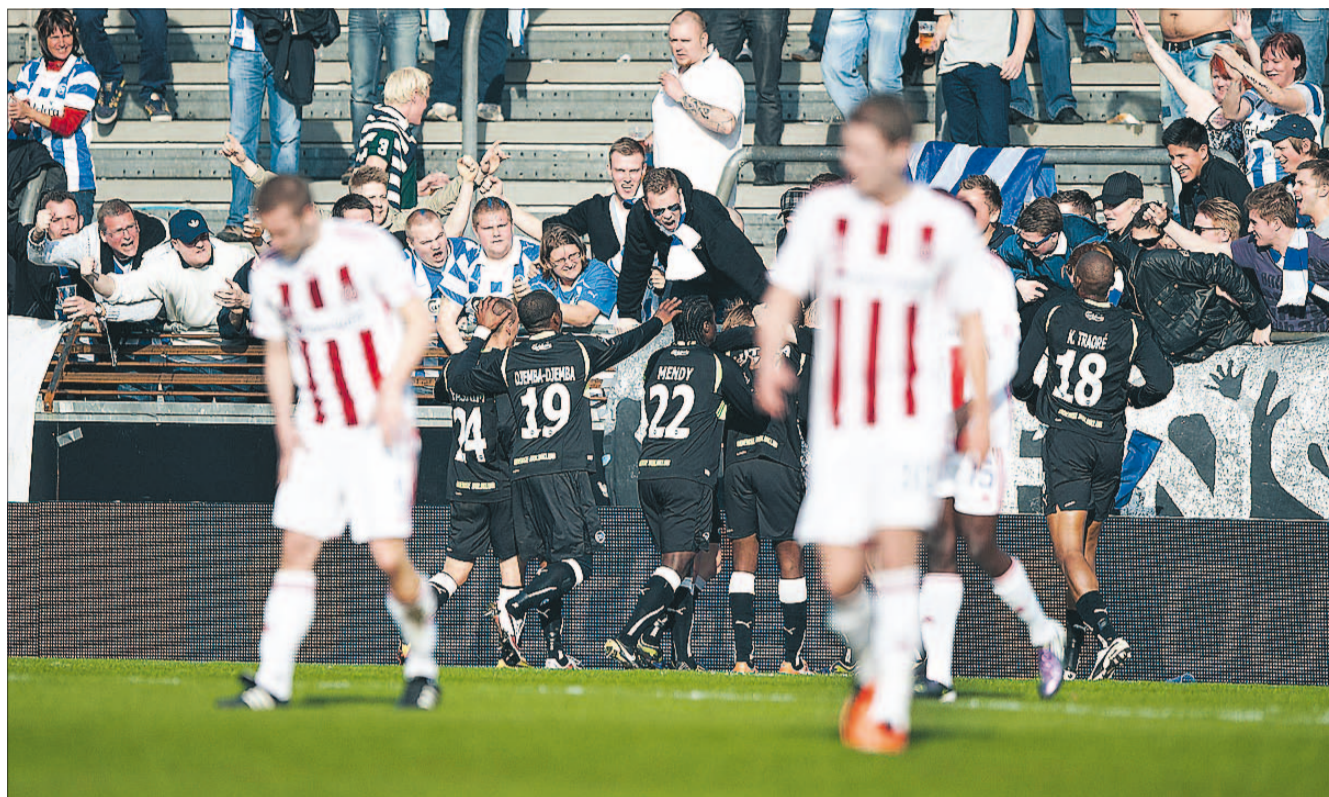
Politiet måtte i aktion mod fodboldfans forud for gårdsdagens kamp.

VEJRET findes på næstsiste side i By&Liv-sektionen.