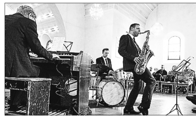
Come Sunday spiller jazz i Astrup Kirke torsdag aften. Koncerten er en del af Vendsyssel Festival.

Lige nu gearer trafikanter på gennemfartsvejen Skærum/Tårsvej ned af en hel anden grund. Den nærmeste nabo til det kommende torv er ved at blive at blive lagt i murbrokker, og den tidligere sparekassebygning bliver kørt væk sten for sten.