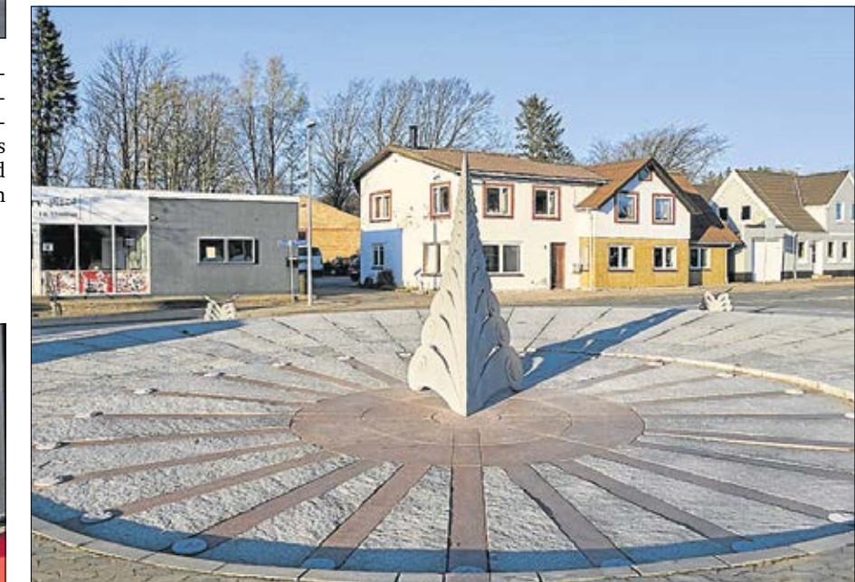
Urviseren, gnomon, er monteret, og skyggen viser klokken med en rimelig nøjagtighed.